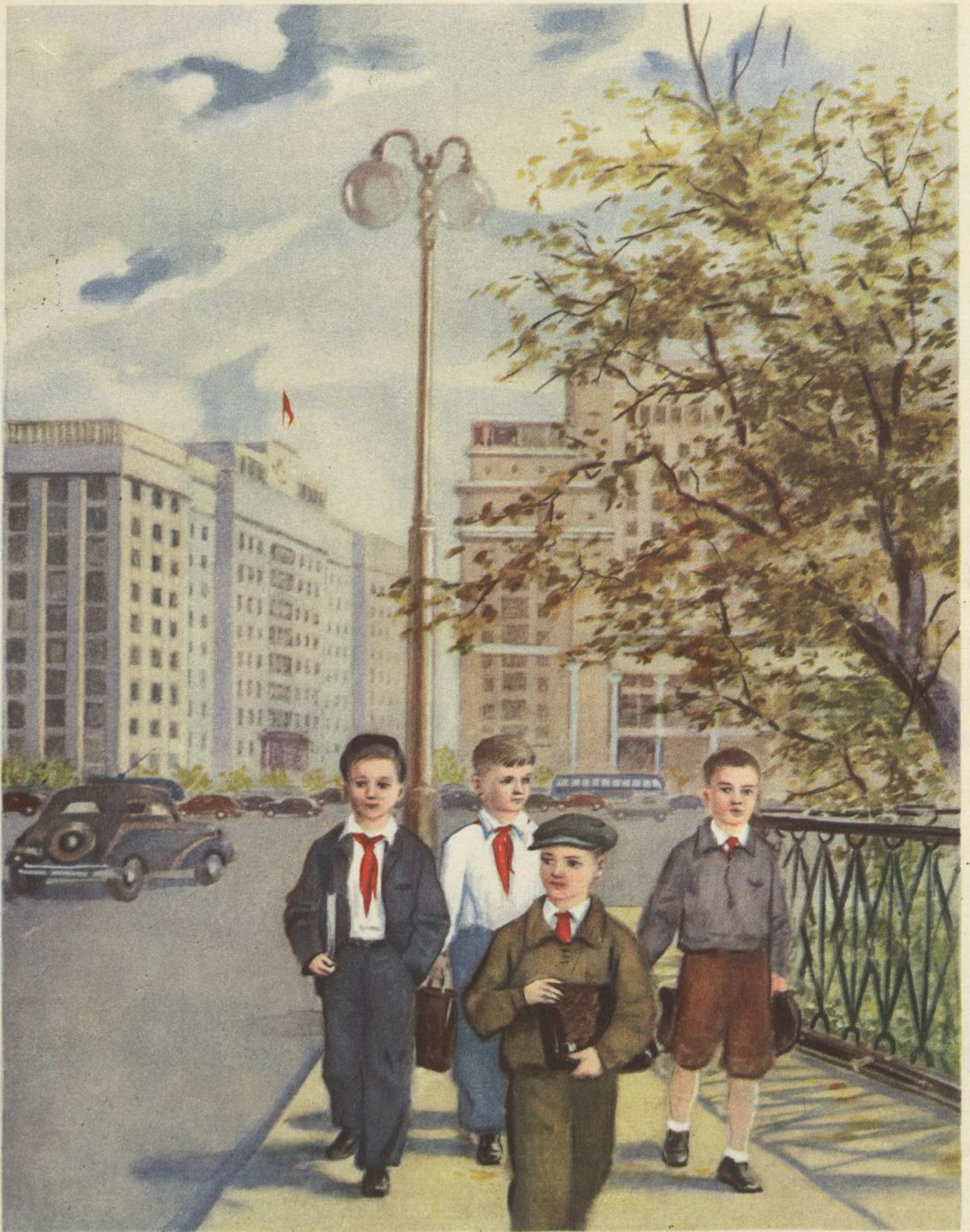
1 сентября в Москве.