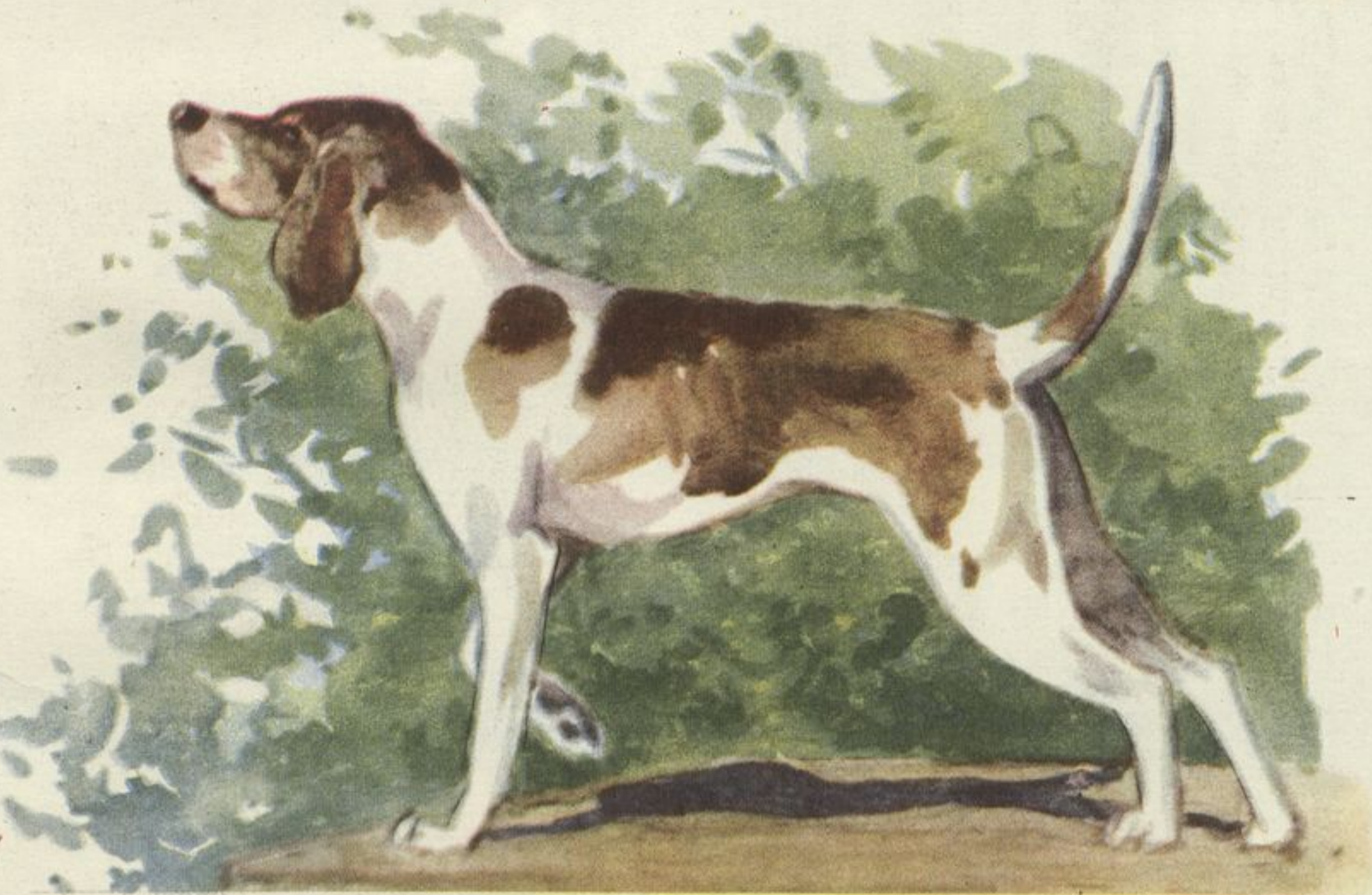
На обложке рисунок А. В. Гохберг

«Кажется, больше не будут кусать: за лето я всю эту дрянь начисто переловил».